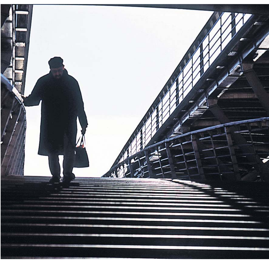
Statistisch besonders gefährlich sind die erste und die letzte Treppenstufe.

Knochenbrüche vermeiden Trotz Sturzprävention lassen sich nicht alle Stürze vermeiden. Um die Schwere der Sturzfolgen zu vermindern, wurden deshalb zusätzliche Massnahmen entwickelt, die heute neben der Sturzprävention als eine weitere Möglichkeiten zur Vermeidung von Knochenbrüchen zur Verfügung stehen. Hierzu gehören der Einsatz von Hüftprotektoren, und ei-