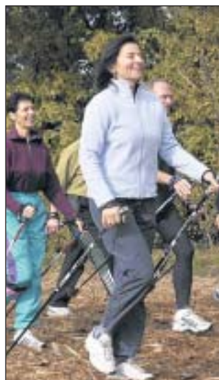
Nordic Walking: Auf die richtige Haltung kommt es an

Ein genussvolles und naturnahes Gemeinschaftserlebnis für alle!