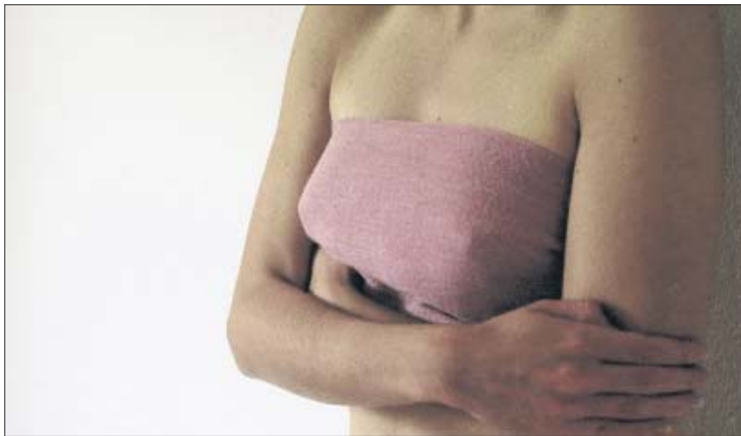
Was kann ich selber tun? Die Brust untersuchen! Eine Anleitung dazu gibts kostenlos bei der Krebsliga Aargau

Es lässt sich nicht wegdiskutieren, von allen Frauen, die in der Schweiz leben, erkranken jedes Jahr rund 5000 an Brustkrebs. Die Tatsache, die noch mehr aufhorchen lässt, ist, dass es immer mehr Frauen werden. Weil das Vorkommen von Brustkrebs mit zunehmendem Alter auch zunimmt, lässt sich dieser Zuwachs teilweise dadurch erklären, dass die Menschen und damit auch die Frauen immer älter werden können. Das ist aber nur einer von vielen Erklärungsversuchen, nach wie vor sind die Ursachen für Brustkrebs weitgehend unbekannt. Auf verschiedenen Gebieten können aber ältere und jüngere Frauen aktiv werden